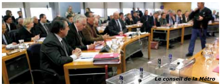
Le conseil de la Métro